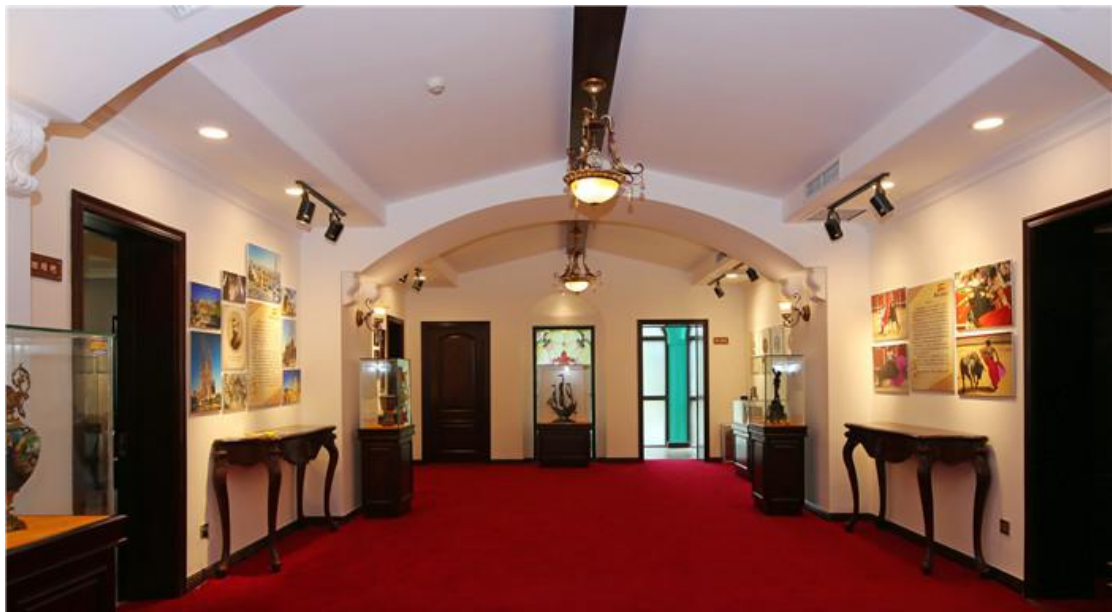
西班牙风情馆：融音乐、舞蹈、美食和绘画于一炉的浓郁的西班牙文艺风潮