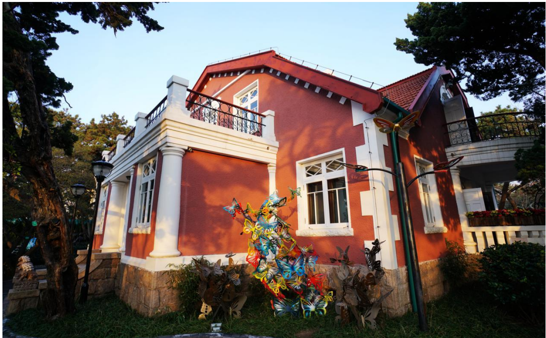
蝴蝶楼：折衷主意别墅，由中俄两国建筑师共同设计