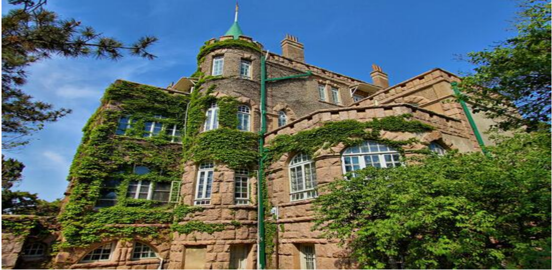
花石楼：外墙由花岗岩石砌筑，塔楼顶部为雉堞式女儿墙

八大关建筑群是闻名中外的旅游疗养胜地，又是优美的风景区。2001年被国务院公布为全国重点文物保护单位。建筑群自20世纪20年代末开始兴建，至30年代末期基本形成规模，现有房屋建筑近400栋，建筑多为欧美建筑的各式别墅，有20余个国家的建筑风格，因此，八大关又有世界建筑博览会之称。