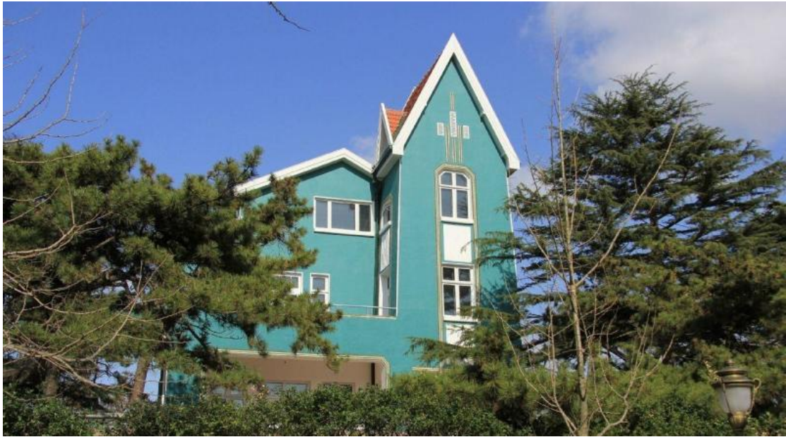
公主楼：丹麦式建筑，其外部由一组不规则斜顶屋面组成，绿墙红瓦，松柏掩映