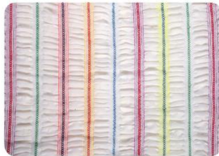
W-A118XXL PASM 3/16