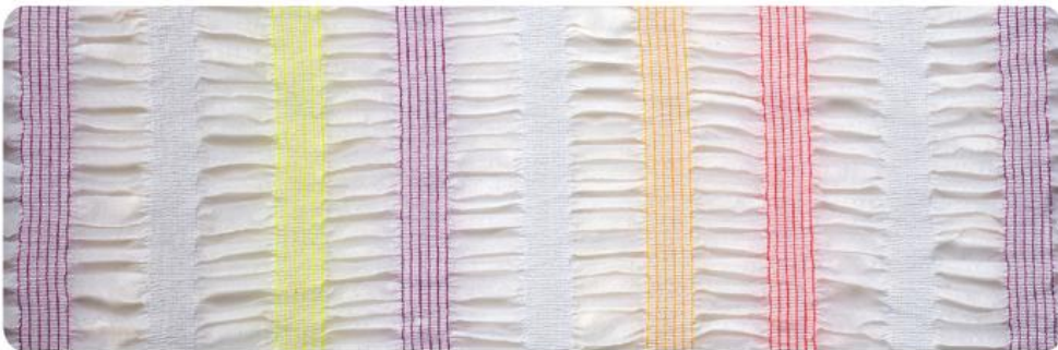
W-A118XXL PAS 3/16