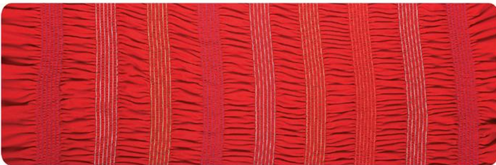
W-A118XXL PQS 3/16