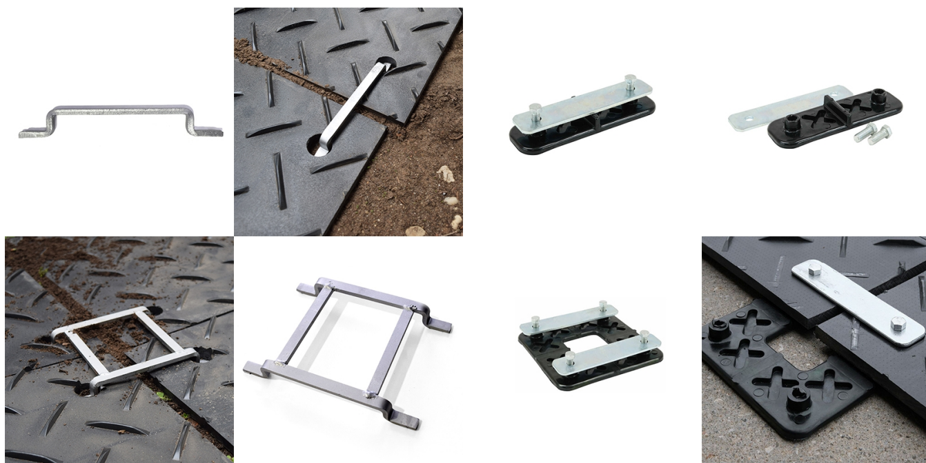
2 头和 4 头连接器